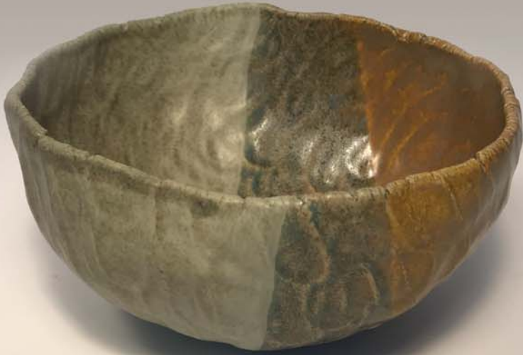
Pot à cactus Mireille Gaudet 50 $