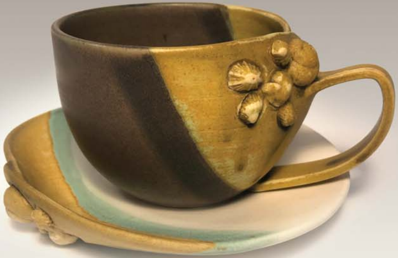
Ensemble cappuccino Katrina Colbourne 50 $