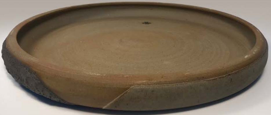
Plateau de présentation David Camirand 75 $