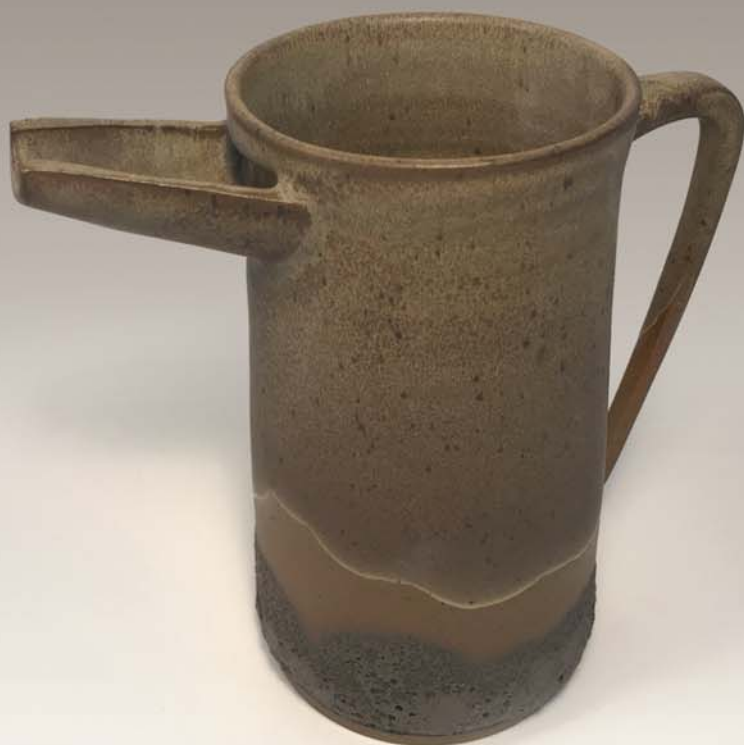
Petit pichet David Camirand 55 $