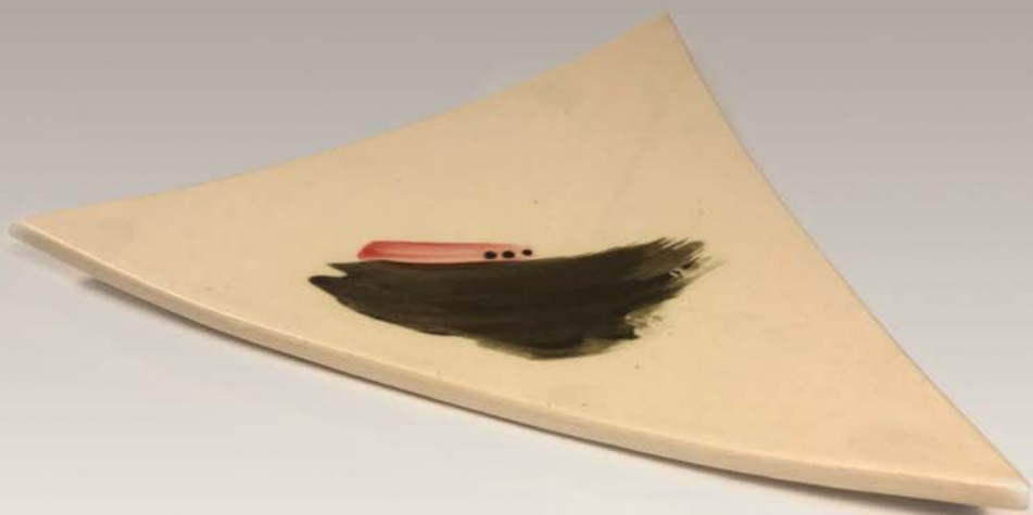
Assiette à déjeuner Stéphane Bouchard des Ateliers Charlevoix 40 $