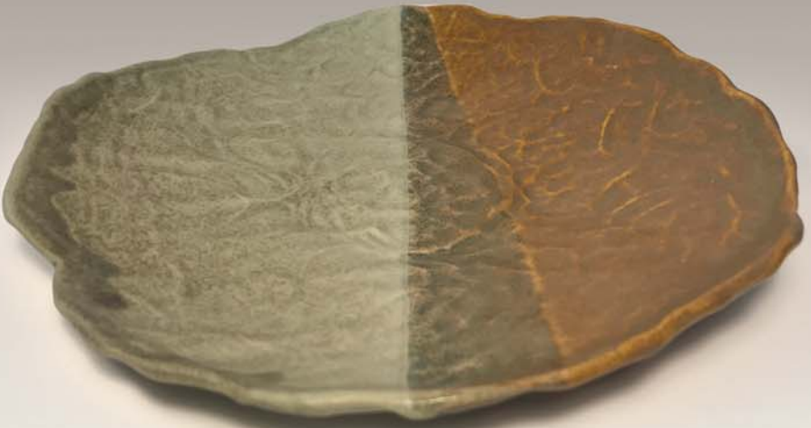
Assiette apéro Mireille Gaudet 40 $