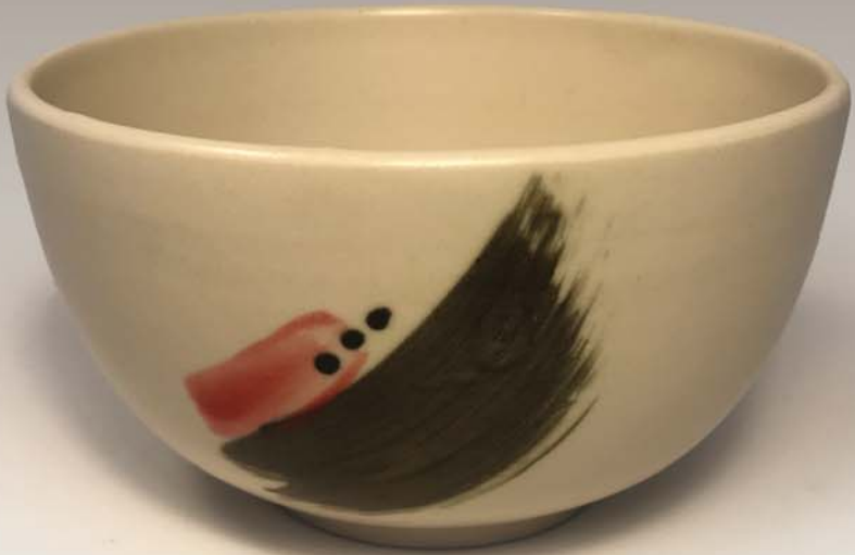
Bol à café au lait Stéphane Bouchard des Ateliers Charlevoix 35 $