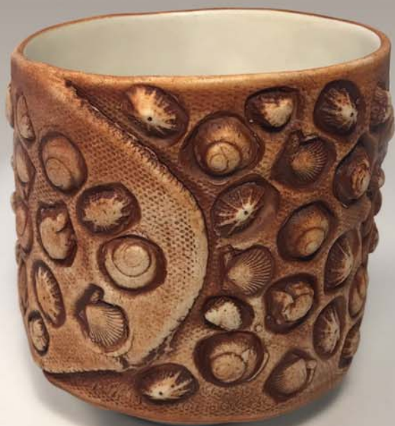
Bol shawan Katrina Colbourne 45 $