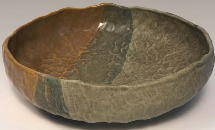
Bol repas Mireille Gaudet 60 $