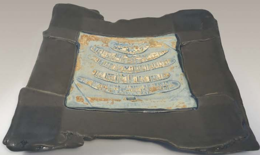
Plateau de service Katrina Colbourne 75 $